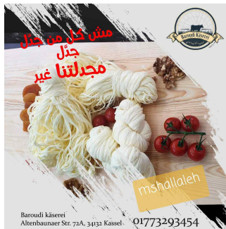
„Käserei Al Baroudi“