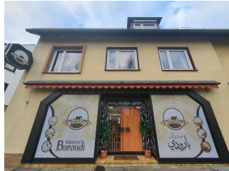
„Käserei Al Baroudi“