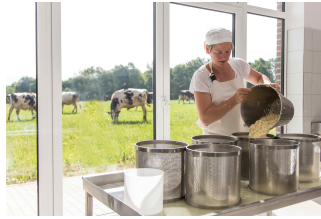
„Bauckhof Käserei Amelinghausen“